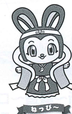
おっぴー ふるさと加西観光大使