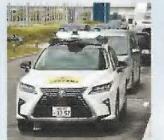
愛知で行われた自動運転の実証実験

日本では、自動ブレーキや、車間距離を維持するシステムなど、レベル2までの技術を採用した車がすでに販売されている。交通事故の減少や渋滞の緩和、人手不足の解消といった効果が期待される。政府は、2025年までに高速道路での完全自動運転の実現を自指している。